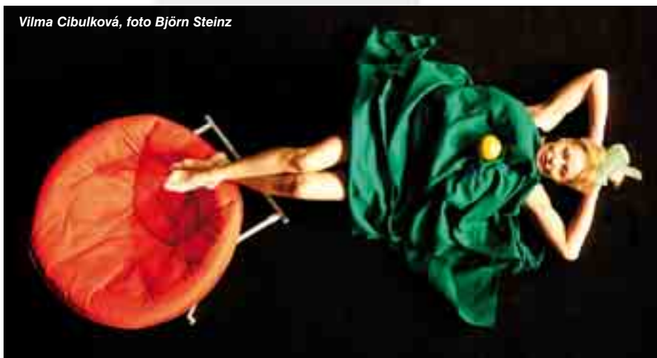
Vilma Cibulková