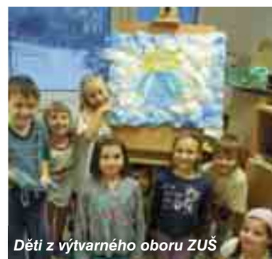
Děti z výtvarného oboru ZUŠ