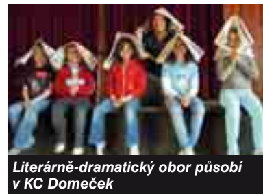
Literárně-dramatický obor působí v KC Domeček

Na přijímací zkoušky není potřeba žádná zvláštní příprava. Seznamy přijatých žáků budou zveřejněny na www.zus-hp.cz a na nástěnce školy 22. 6. odpoledne.