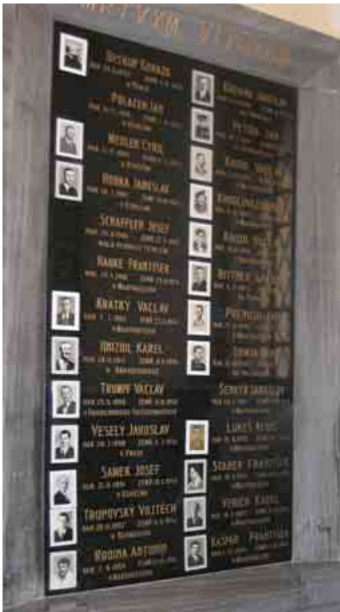
Pamětní deska obětem fašismu v kostele sv. Ludmily na Chvalech