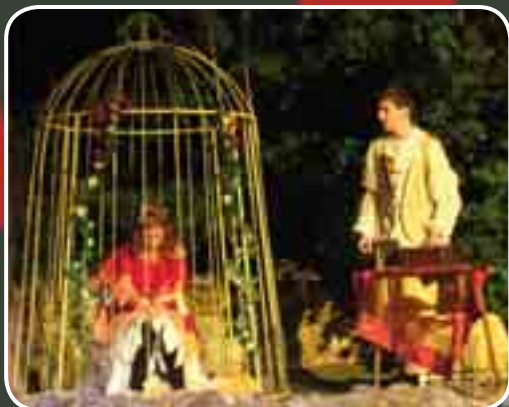
Pták Onivák