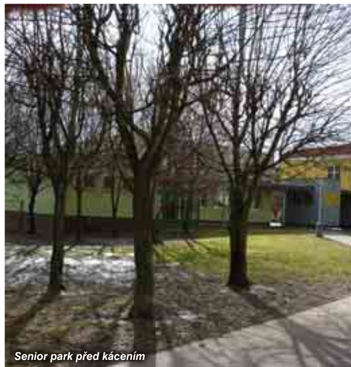
Senior park před kácením

Od firmy VGP PARK se nám podařilo získat pro počernické gymnastky finanční dar ve výši 20 tisíc korun.