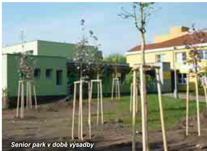
Senior park v době výsadby

V rybnících Starák a Podsuchrovský se objevila rostlina rdes, která zcela pokryla jejich hladiny. Ve spolupráci s odborem životního prostředí magistrátu jsme vysadili do Podsuchrovského rybníka 100 amurů, kteří by tuto rostlinu měli likvidovat. K tomuto opatření by mělo dojít také u rybníku Starák.