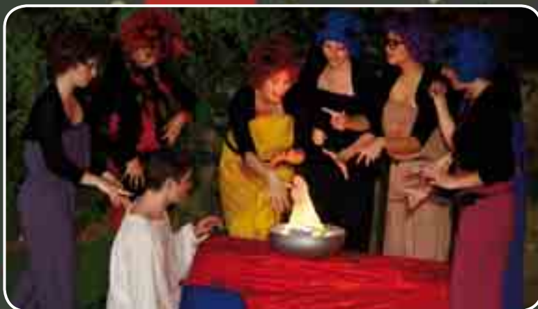
O čertech, čerticích, Fouskovi a sušené borůvce

ZMĚNA PROGRAMU VYHRAZENA http://www.divadlopocernice.cz/domecek/divadlo