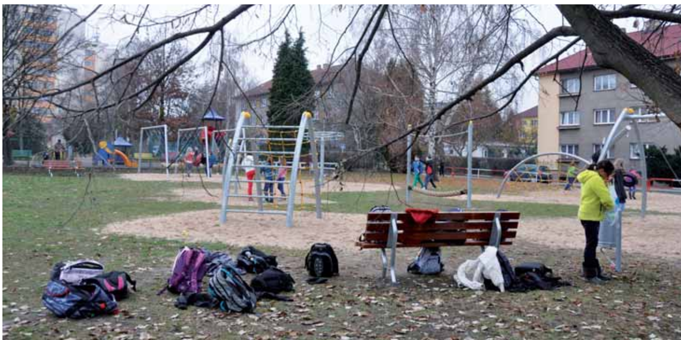
Od listopadu je hřiště doslova v obležení dětí a to i za nepříznivého počasí.