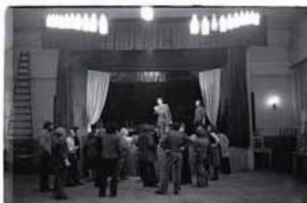
Před světovou premiérou Žebrácké opery v sále restaurace U Čelíkovských, 1975