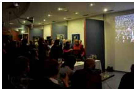
Projekce fotografií B. Holomíčka