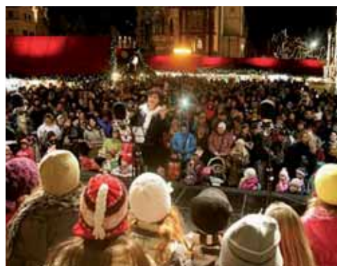
Pěvecký sbor Paleček se sbormistryní Z. Hejlíkovou na Staroměstském náměstí