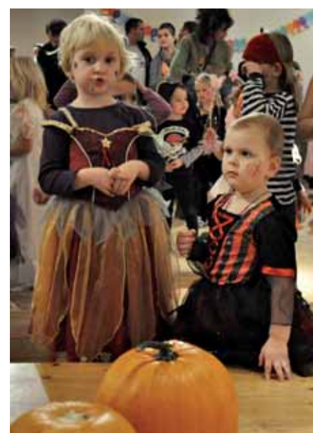
Strašidelný maškarní bál– 17. 11.