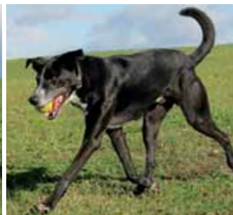
Zleva: Čudla, Arýsek, Belinda a Max na vás čekají v útulku v Kralupech.