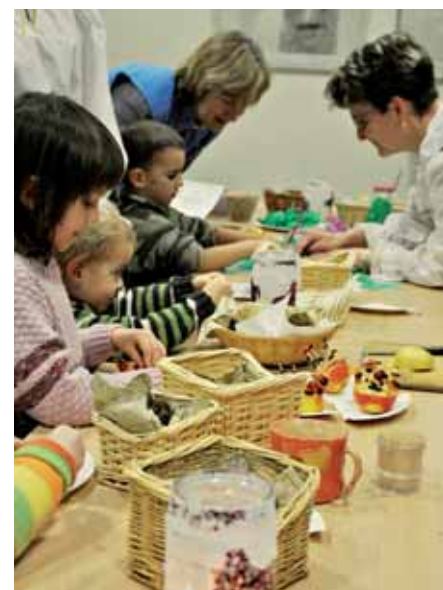
Vánoční veselí – 9. 12. na Chvalském zámku