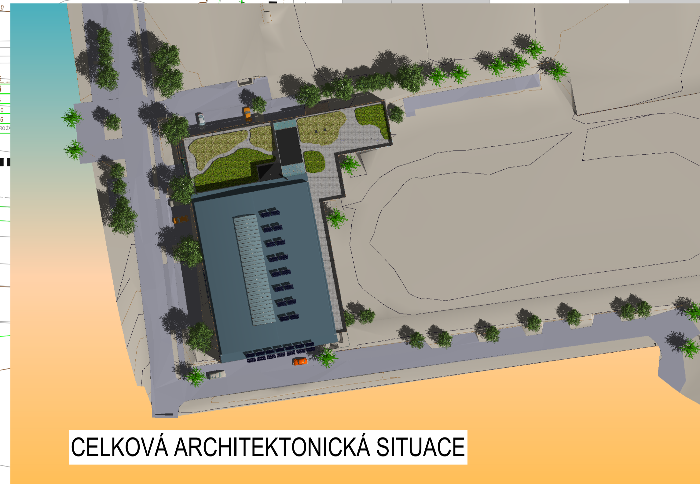
CELKOVÁ ARCHITEKTONICKÁ SITUACE