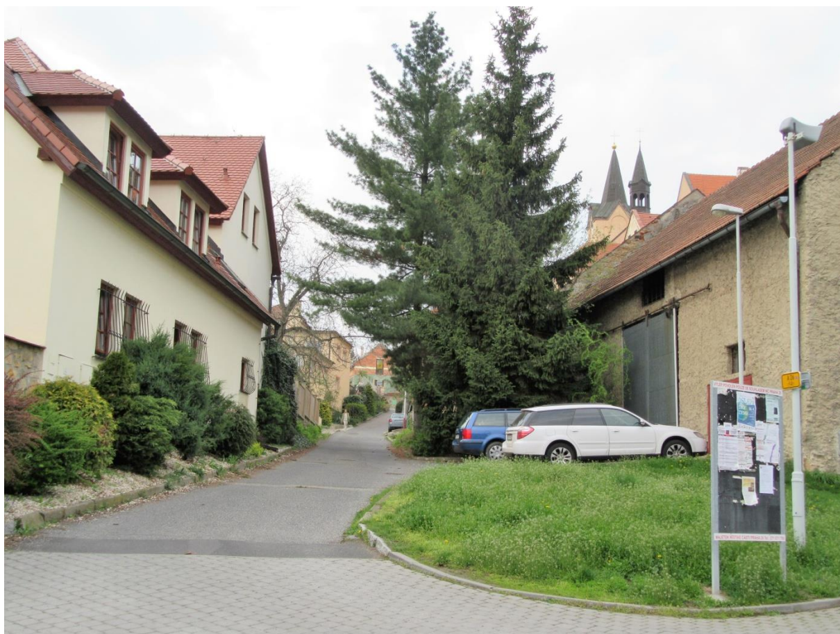
Řešovská ulice s věžičkami Kostela sv. Ludmily

Klidný přístup do/z celého Chvalského areálu pro cyklisty doporučuji klidnější, i když svažitou Řešovskou ulicí, podél kostela sv. Ludmily se potom dostanete do areálu.