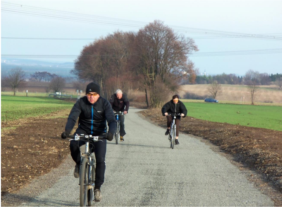
Horní polovina zrekonstruované cyklostezky nad silnicí Lázně Toušeň – Mstětice má štěrkový povrch, dolní polovina je asfaltovaná.