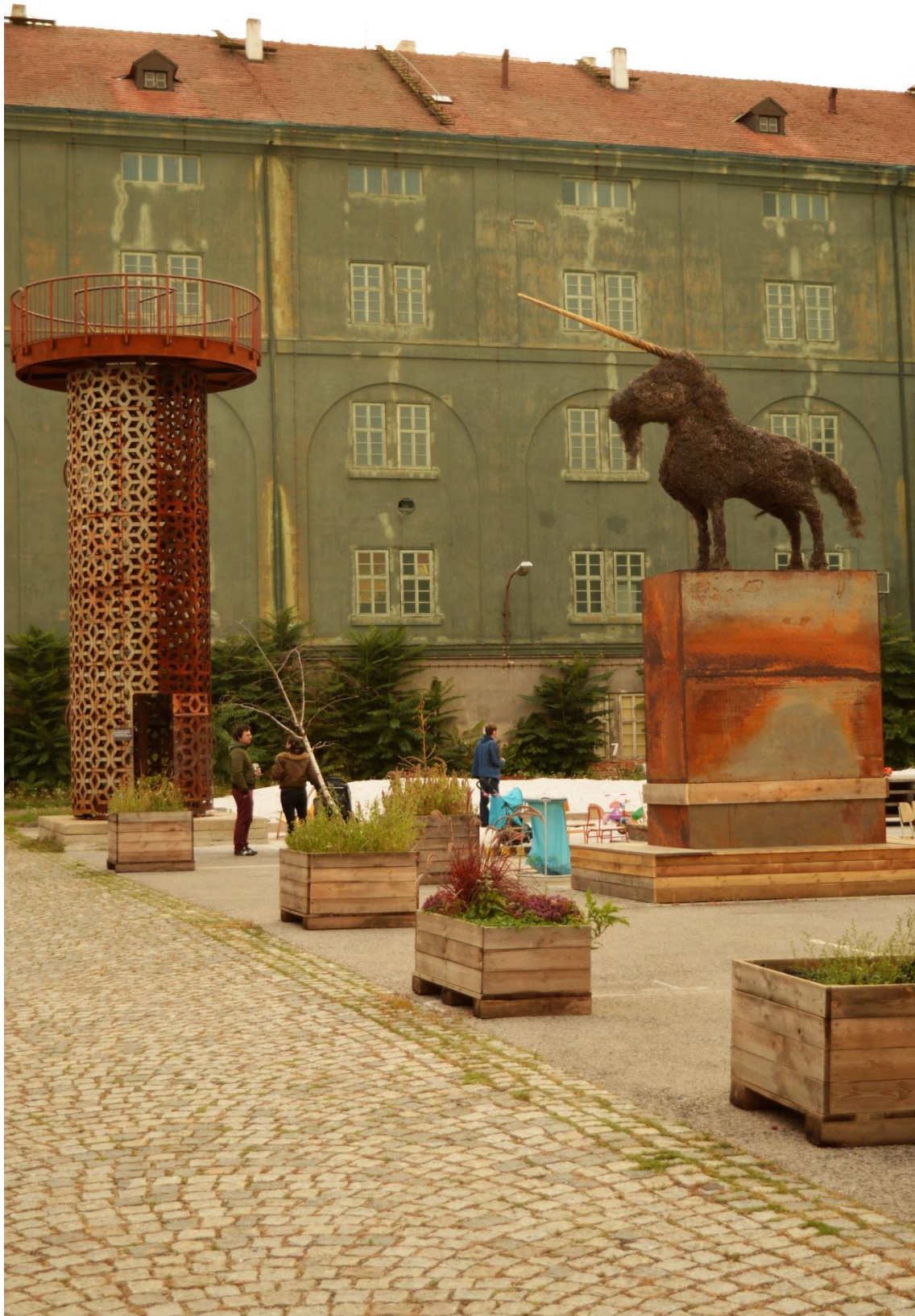
Na svůj čas čekající Kasárna Karlín