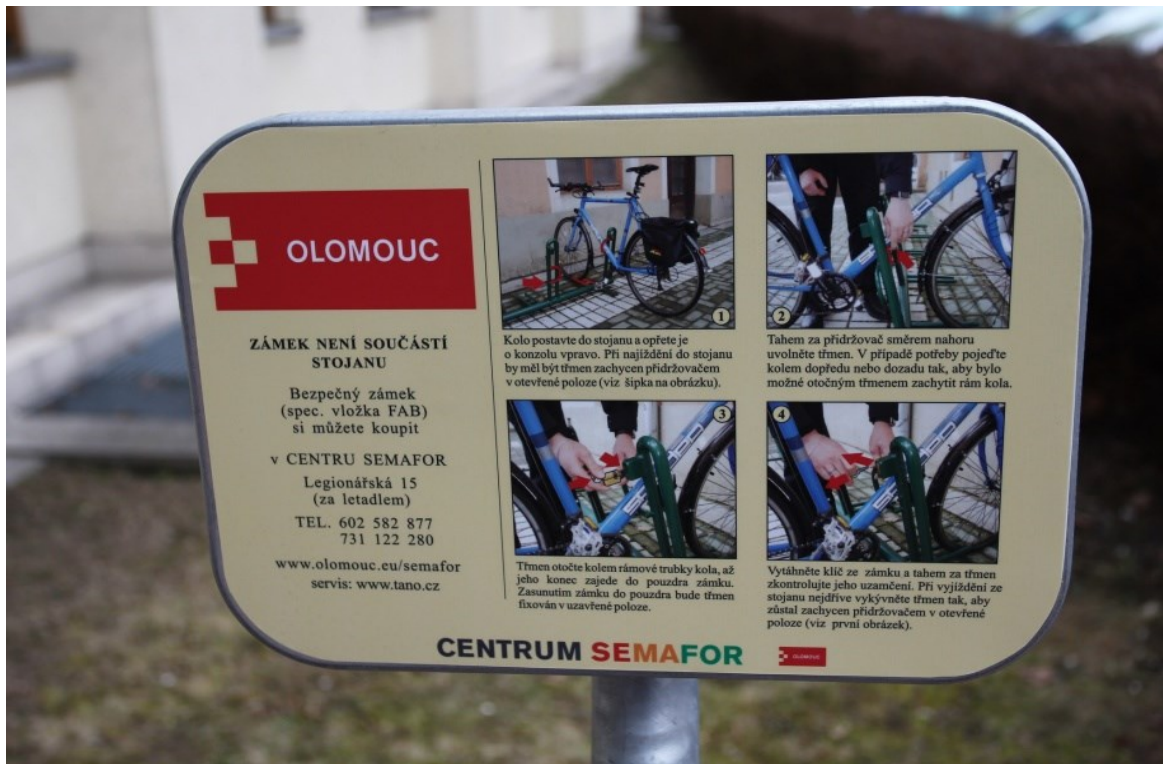
Dobře uzamykatelný systém cyklostožanů v Olomouci.