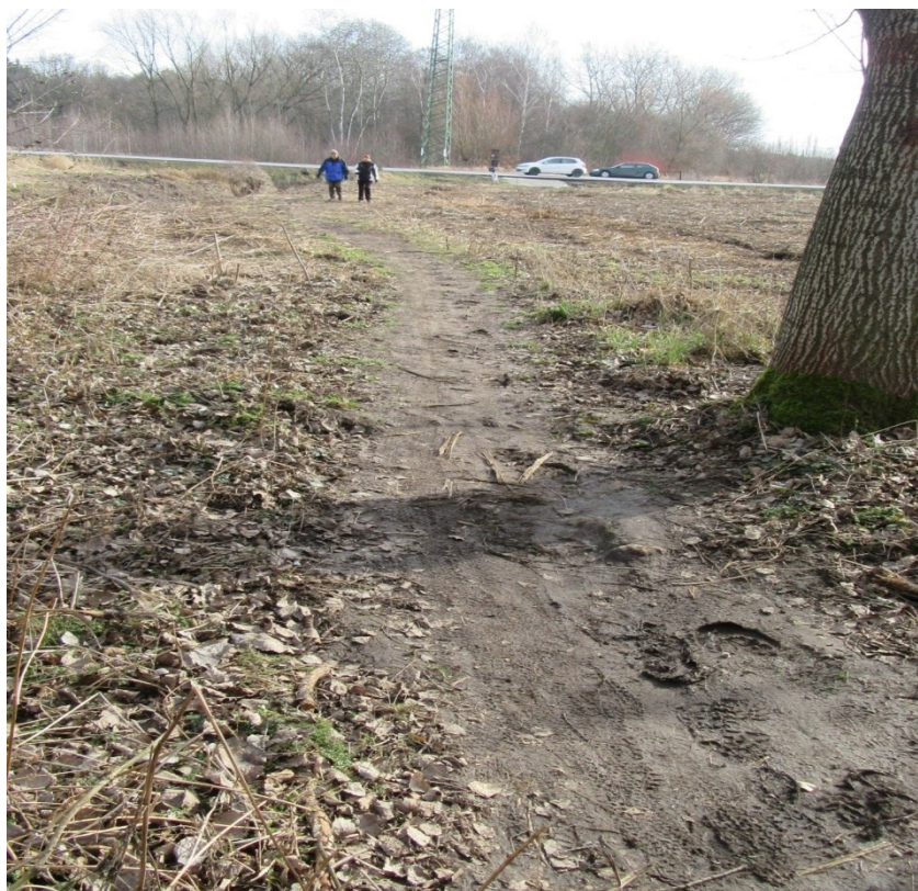
Dnes již historický snímek, občasné holoseče.