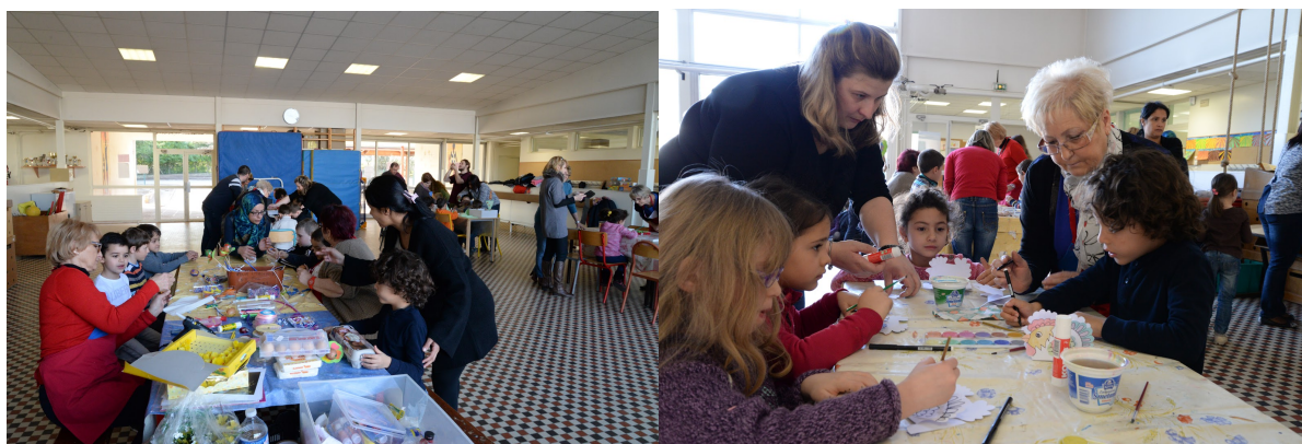
Velikonoční dílničky v Mions připravují členové VPP a Comité de Jumelage už deset let.