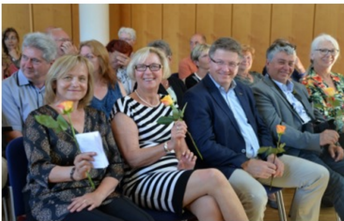
Vernisáž výstavy fotografa Karla Cudlína v Městské galerii Elbeforum

stihla svět smutná zpráva o odchodu bývalého německého kancléře Helmuta Kohla. Tento velký Evropan přispěl k pádu komunismu ve střední a východní Evropě a vždy byl zastáncem evropské integrace. Partnerství mezi našimi městy je jedním ze způsobů, jak můžeme k této integraci přispět a čelit tak skeptickému vztahu k Evropské Unii. Uplynulá léta ukázala, že jsme schopni vytvářet mezi sebou stále pevnější vazby přátelství.