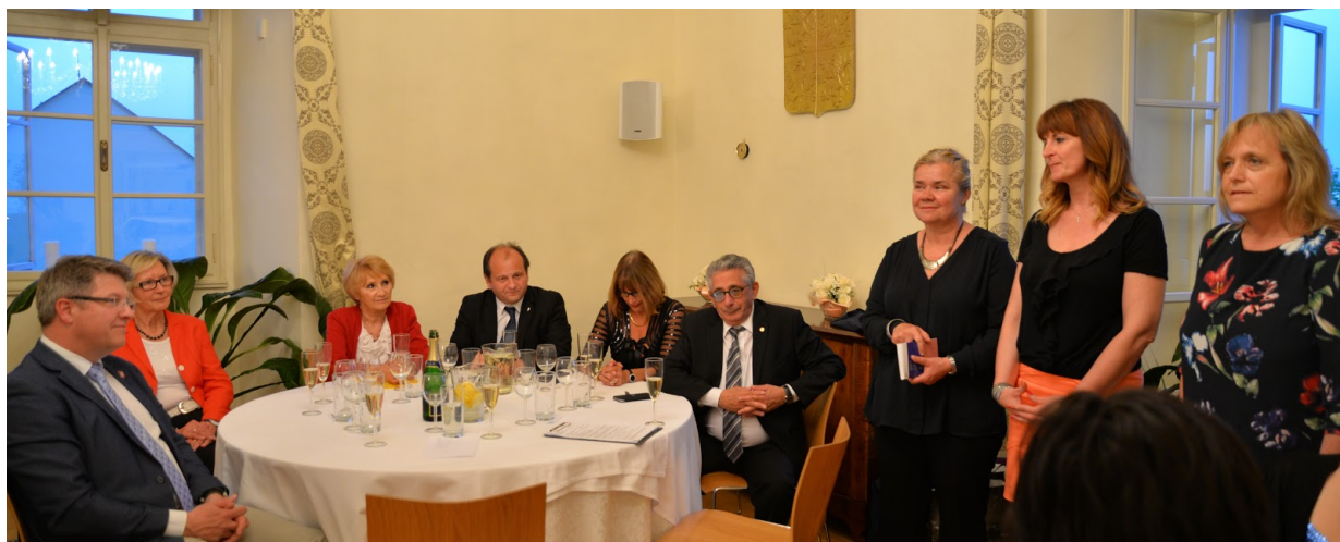
Oficiální večeře na Chvalském zámku