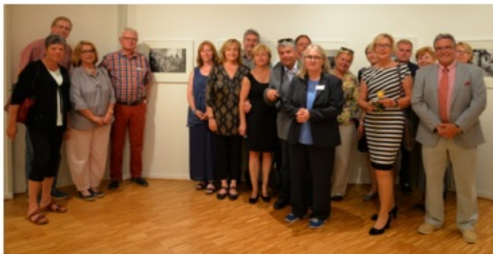
Výstava Unterwegs in den Osten potrvá do konce července