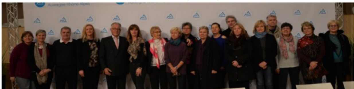
Členové delegace v parlamentu regionu Auvergne-Rhône-Alpes

Text a foto Dana Mojžíšová a Robert Chapat