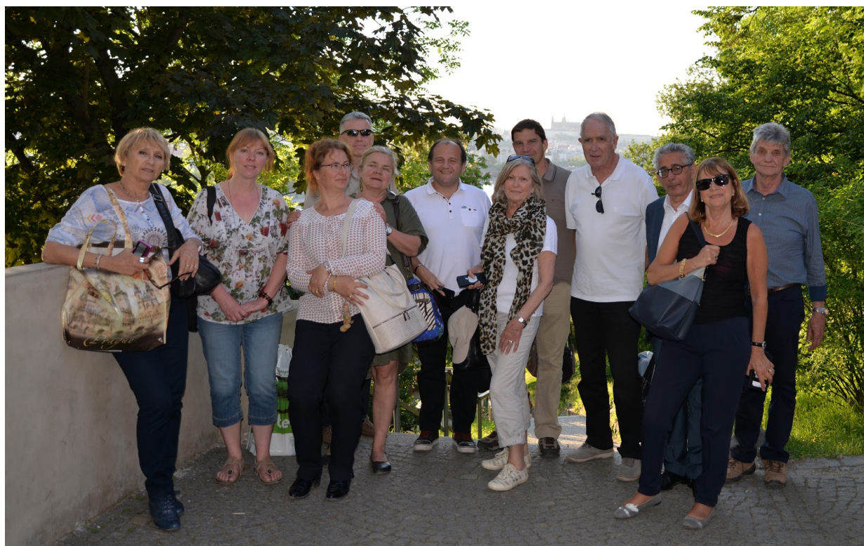
Francouzská delegace na Vyšehradě