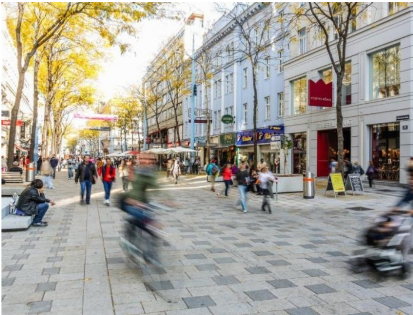
Obrázek 2 Ilustrační foto města Vídně.

„Mobilita potřebuje dopravu, která je humánní a ekologická. Město Vídeň se zavázalo k podpoře veřejné, pěší a cyklistické dopravy, protože tyto způsoby dopravy jsou nejohleduplnější k životnímu prostředí. Vídeň ztělesňuje politiku městské mobility, která je orientovaná na budoucnost a která není jen ekologická, ale i společensky a ekonomicky akceptovatelná, a tedy udržitelná. Je ekonomicky udržitelná, protože je postavená na dlouhodobých investicích, které jsou výhodné pro město i celou lokalitu. Je sociálně udržitelná, protože jejím deklarovaným cílem je zajistit mobilitu pro všechny bez ohledu na výši příjmů, společenské postavení a momentální životní situaci. Je ekologicky udržitelná, protože pomáhá zachovat přírodní zdroje a přispívá k realizaci cílů Smart City Vídeň.“ Citace ze STEP 2025.