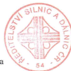
Bc. Tomáš Skála

Zpracoval: Miloš Vizner Technický pracovník Tel: 325 594 471-2