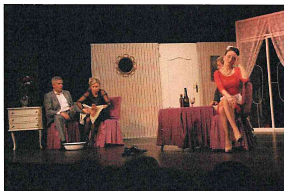
Má žena si vyšla / Právě začínáme / režie Stanislav Tomek