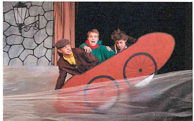
Rychlé šípy / Zeptejte se kocoura / režie Barbora Jelínková