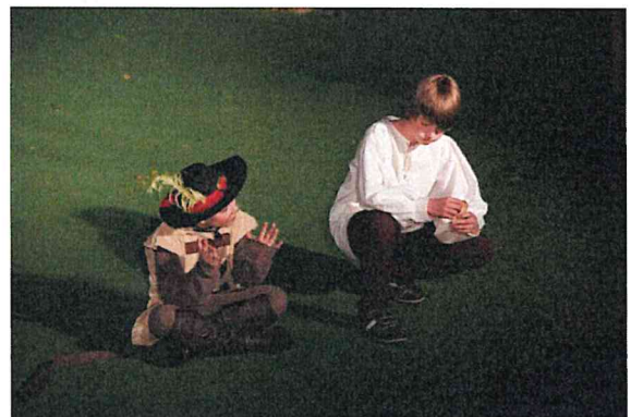
Kocour v botách / Počerníčci / režie Jana Šůvová, Klára Šimicová