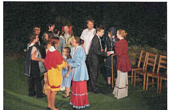
Dobrodružství Toma Sawyera / Počerníci / režie Jana Šůvová, Klára Šimicová