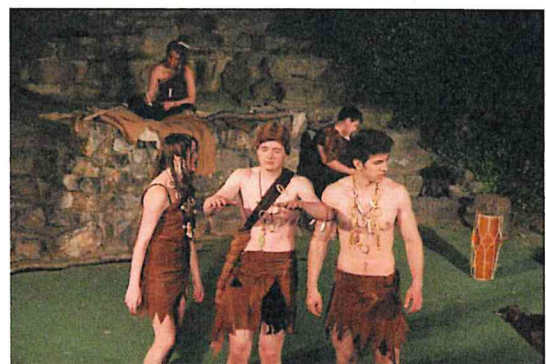
Doba kamenná / Počerničci / režie Zdena Víznerová, Olina Šmejkalová