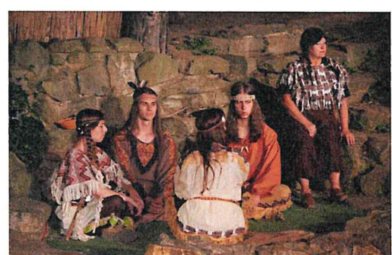
Vinnetou – pokrevní bratrství / Právě začínáme / režie Filip Minařík