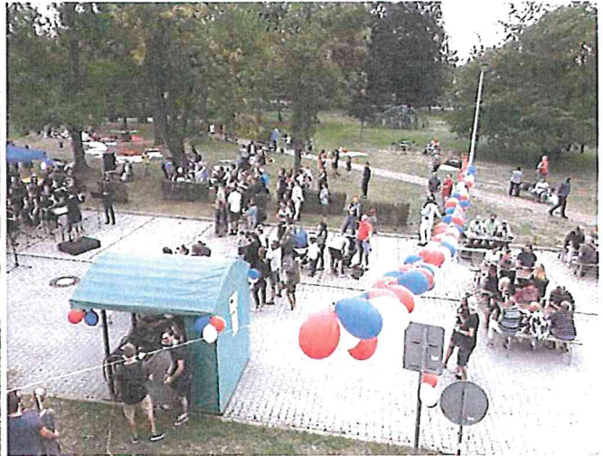
Zahájení sezóny – Téma první republika