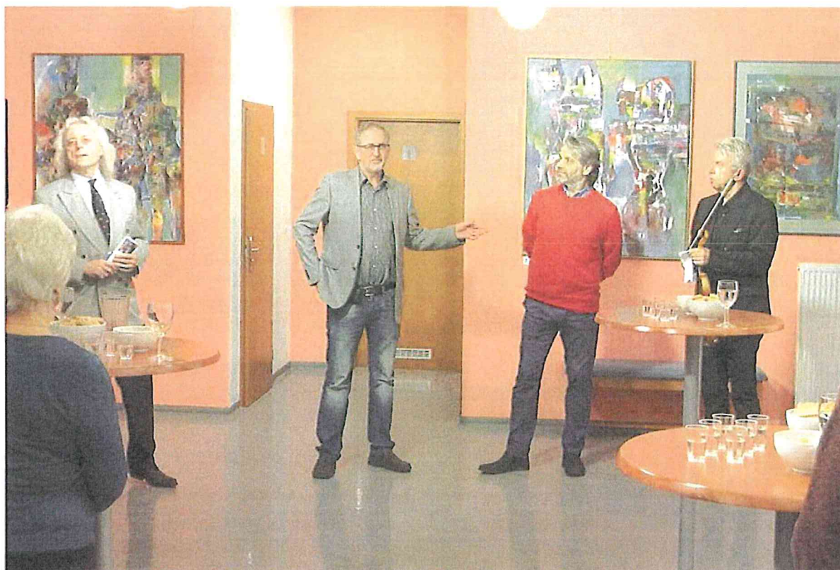
Vernisáže v divadle