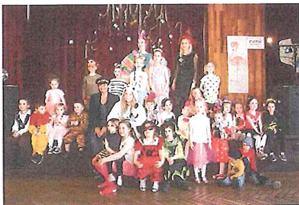
Maškarní ples Mumraj

Jako každoročně i letos jsme byli spoluorganizátoři celostátní recitační soutěže mladých recitátorů Memoriál Rosti Čtvrtlíka .