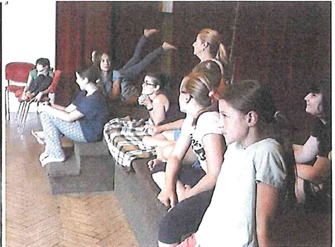
Divadelní příměstský tábor