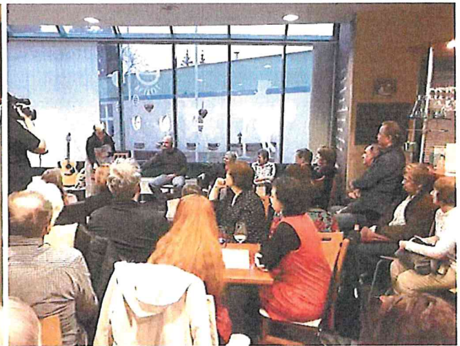
Představení v Divadelní kavárně v rámci výstavy Reynkovi