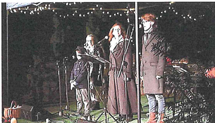
Zpívání pod vánočním stromem