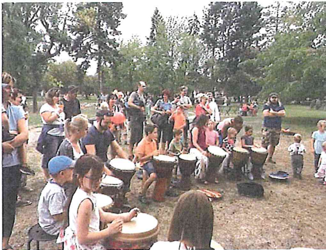
Zahájení sezóny – bubnický workshop