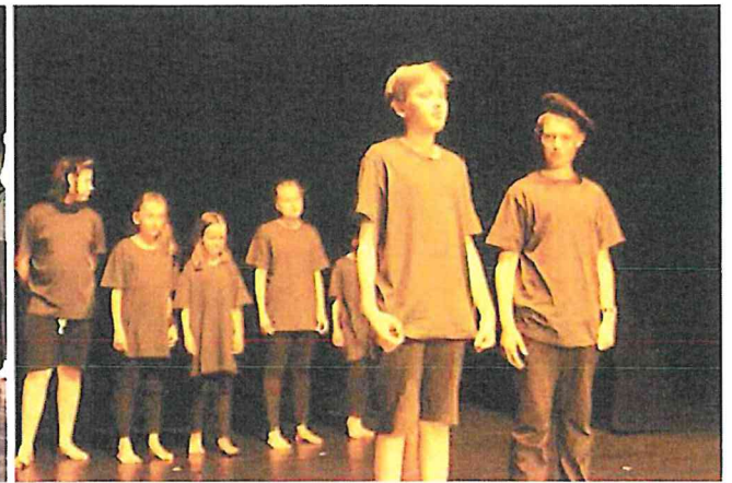
Závěrečné vystoupení dětí v rámci příměstského tábora