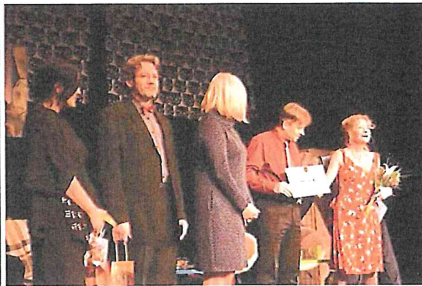
Benefiční představení pro SKP HOPO