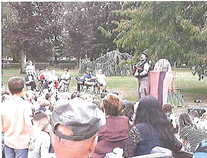
Zahájení sezóny – Divadlo Harmonika