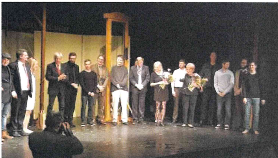
Světová premiéra inscenace Lízinka

Ve spolupráci s dalšími místními spolky a organizacemi se KC Horní Počernice podílelo na realizaci akce Počernické kuře – Pomozte dětem a bylo hlavním pořadatelem tradičního Zpívání pod vánočním stromem.