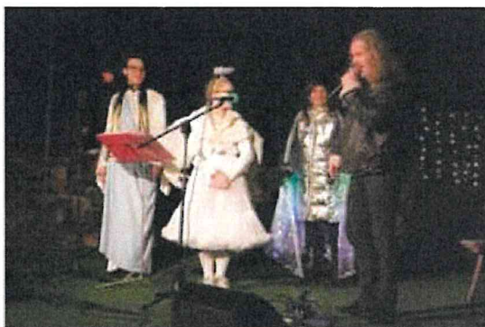
Zpívání pod vánočním stromem