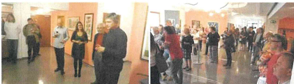
Vernisáže v divadle