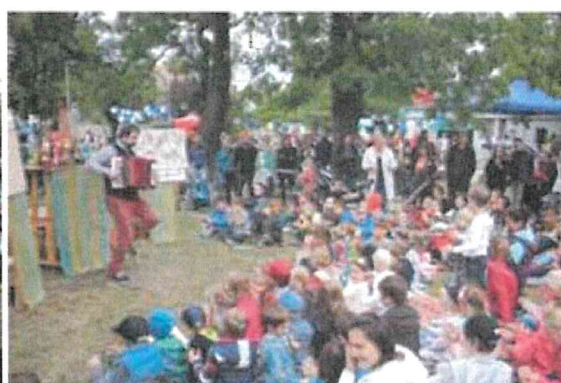
Zahájení sezóny – Divadlo Harmonika