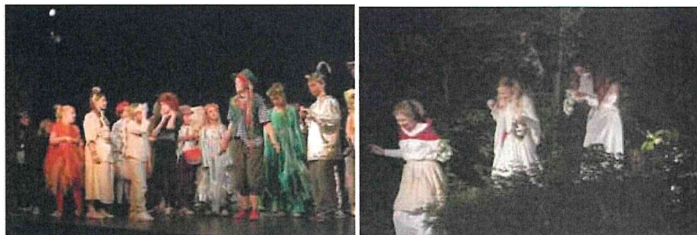
Festival Divadlo v přírodě

V režimu pronájmu zde uskutečnily koncerty žáků a učitelů ZUŠ Horní Počernice, dále se v divadle konaly akademie několika tanečních a baletních škol a vystoupení amatérských i profesionálních divadel různých žánrů.