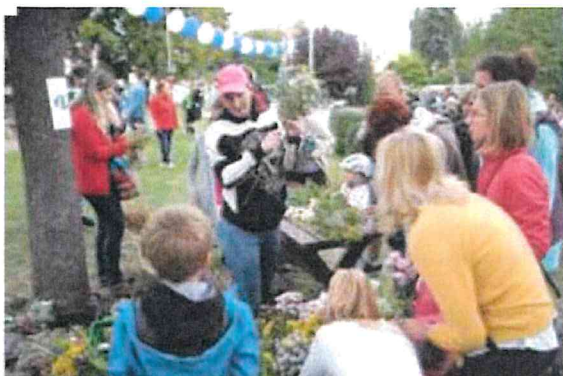
Zahájení sezóny – floristický workshop