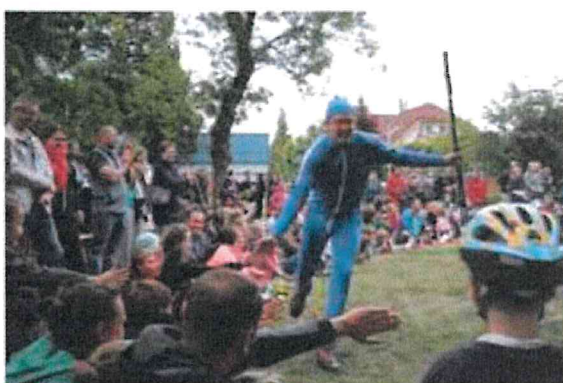
Zahájení sezóny – Bratři v tricku