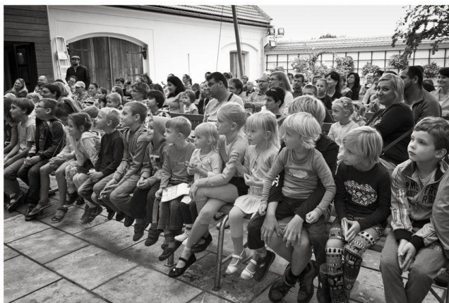
Vysoká návštěvnost dětí – divadlo na nádvoří v rámci Svatoludmilské pouti 2016.