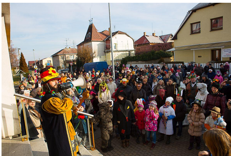
Masopustní průvod na Chvalský zámek 2016

Stále vysokou oblibu a návštěvnost mají tradiční a dlouho pořádané akce - Masopustní průvod, Živý betlém, Zavírání Vánoc se třemi králi a živými velbloudy, Počernická světýlka , na jejichž přípravě spolupracujeme s místními příspěvkovými a neziskovými organizacemi a spolky, s nimiž nás pojí již dlouholetá spolupráce a výborné vzájemné vztahy.