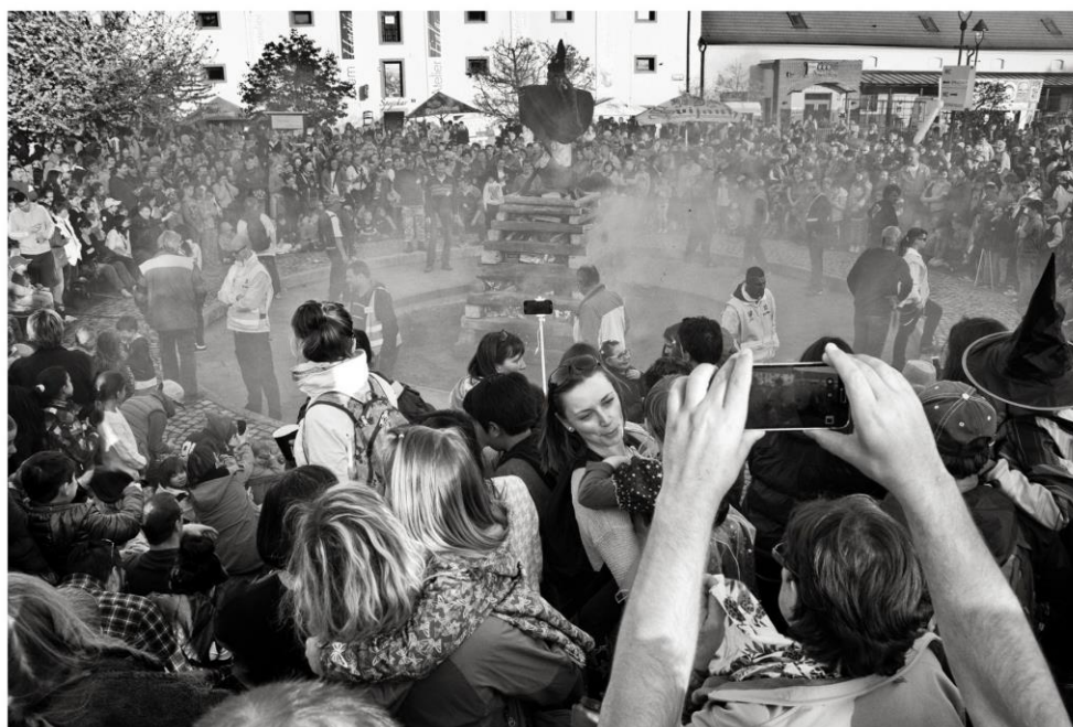
Čarodějnice na Chvalské tvrzi 2016.