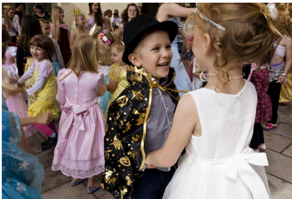
Svatojánský bál princezen, rytířů a princů, 19. 6. 2016

Pohádkové víkendy , zavedené úspěšně v roce 2012, nadále prokázaly svou aktuálnost, neboť i v roce 2016 o ně byl velký zájem návštěvníků. Stejně tak i další akce, zavedené již v roce 2012, se staly tradičními – jedná se o události Tajemná noc na zámku a Svatojánský bál princezen, rytířů a princů . Oblíbenou a nově tradiční akcí je už i Strašidelná noc na Chvalském zámku , poprvé uvedená v roce 2014 a Nocování na zámku pro děti s vílou Ohnivkou, Meluzínkou a skřítkem , jež jsme poprvé realizovali v roce 2015.