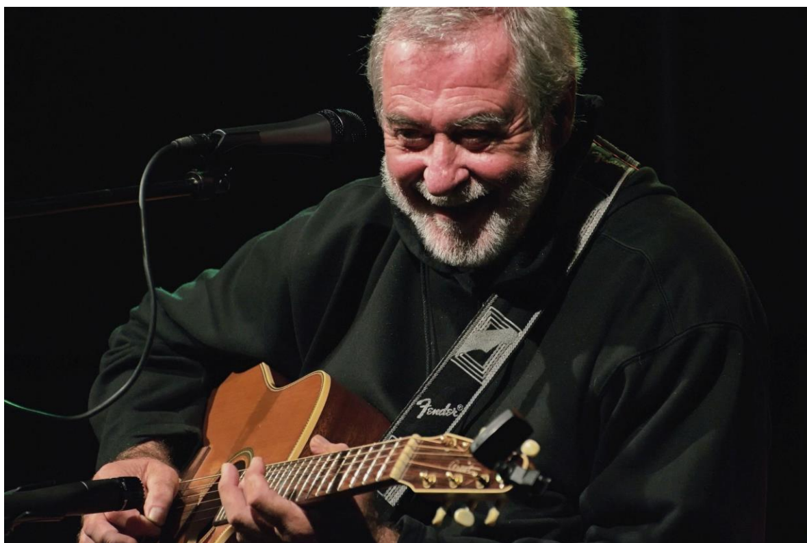
Koncert Michala Prokopa na Chvalském zámku 18. 9. 2016.

Zájmu veřejnosti se těší i již tradiční zářijový koncert na zámeckém nádvoří , kde letos zazářil zpěvák Michal Prokop a Trio . Koncert měl kvalitu, úroveň, skvělou atmosféru a vysokou návštěvnost!