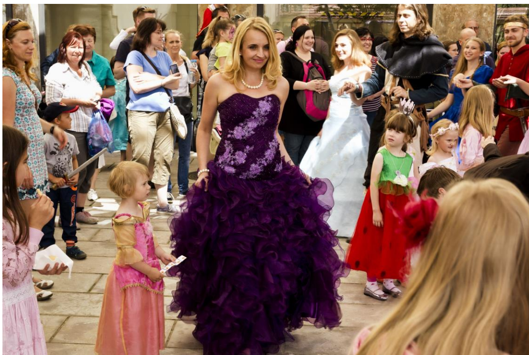
Svatojánský bál princezen, rytířů a princů 19. 6. 2016

Mimo vlastních akcí Chvalský zámek zajišťuje i prezentaci celé městské části, provoz infocentra, zajišťuje zázemí pro společenské a kulturní akce MČ (zasedání zastupitelstva, kulaté stoly zastupitelů, setkání radních s občany, svatby, zámecká posezení pro seniory, vítání občánků, předání občanství), komunikuje se školskými a kulturními institucemi a sdruženími působícími na území naší MČ a participuje na pořádání jejich akcí. Tradici a oblibu si již získala akce, kterou Chvalský zámek pořádá ve spolupráci s MČ Praha 20 – Svatomartinská jízda na zámku aneb Se zastupiteli na víno .