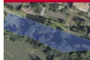
Pozemek - zeleň 2338m 2 Dobrošovská, Horní Počernice

Nově v nabídce pronájem bytů 5+1 a 1+kk v Horních Počernicích!