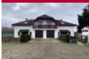
Dvojdomek Ke Xaverovu, Horní Počernice