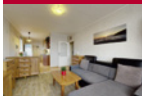
Byt 3+1/L Lhotská, Horní Počernice